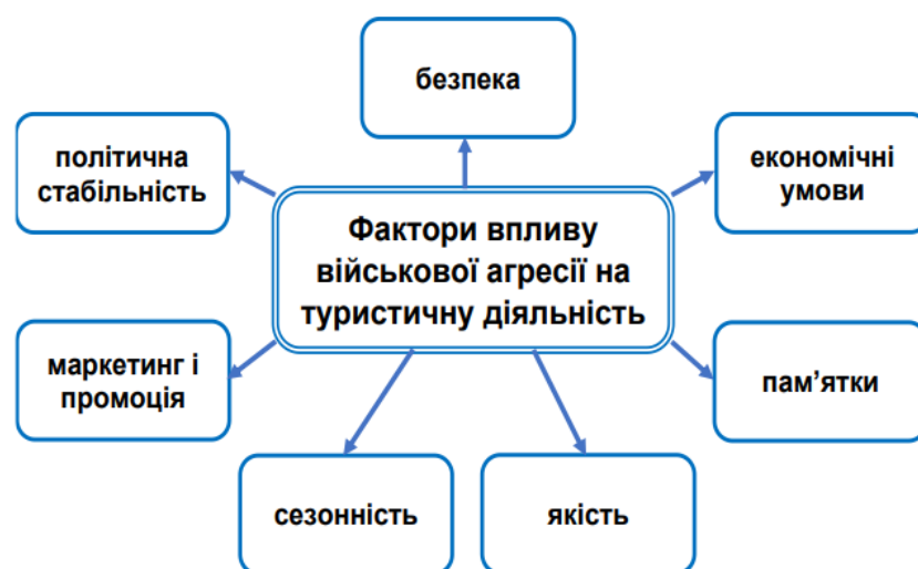
Рис. 2.1. Основні фактори впливу військової агресії на туристичну діяльність в постраждалих регіонах України

Основні фактори впливу військової агресії на туристичну діяльність в постраждалих регіонах (Рис 2.1):