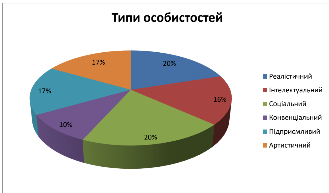
Рис. 2.4. Сегментограма розподілу результатів дослідження типів особистостей респондентів

У більшості респондентів спостерігається перевага соціального та реалістичного типів. До цих типів відносяться по 6 респондентів.