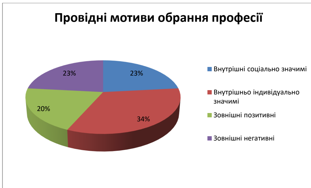
Рис. 2.5. Сегментोगрама розподілу результатів дослідження провідних мотивів вибору професії респондентів

Як видно з результатів експерименту, у респондентів переважає внутрішня індивідуальна мотивація до обрання професійної діяльності. Тобто респонденти спираються при виборі професії на задоволення, яке приносить їм робота в силу тих чи інших факторів (спілкування, творчість, реалізація своїх власних здібностей).