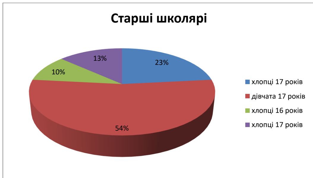
Рис. 2.1. Сегментограма розподілу учасників констатувального експерименту за віком

В експериментально-психологічному дослідженні взяли участь 30 учнів старших класів, які навчаються за однаковими програмами, від 16 до 17 років. Група старших школярів віком: 17 років – 23 особи, 16 років – 7 осіб (див. рис. 2.1).