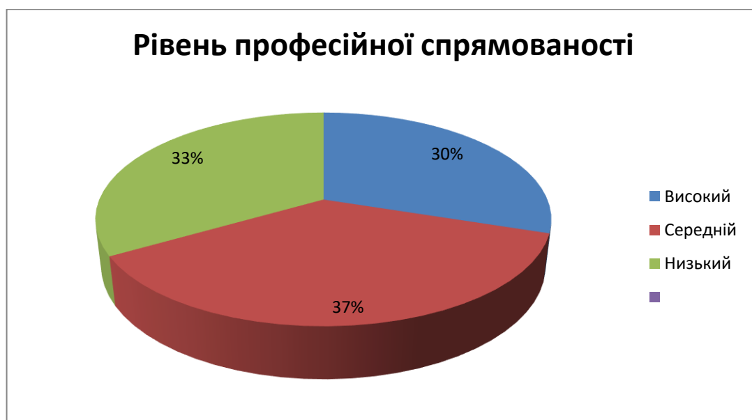
Рис. 2.3. Сегментограма розподілу результатів дослідження за рівнем професійної спрямованості респондентів

Для визначення взаємозв'язку типу особистості та професійної сфери діяльності була застосована методика Дж. Голланда. Результати надано у таблиці (див. табл. 2.3).