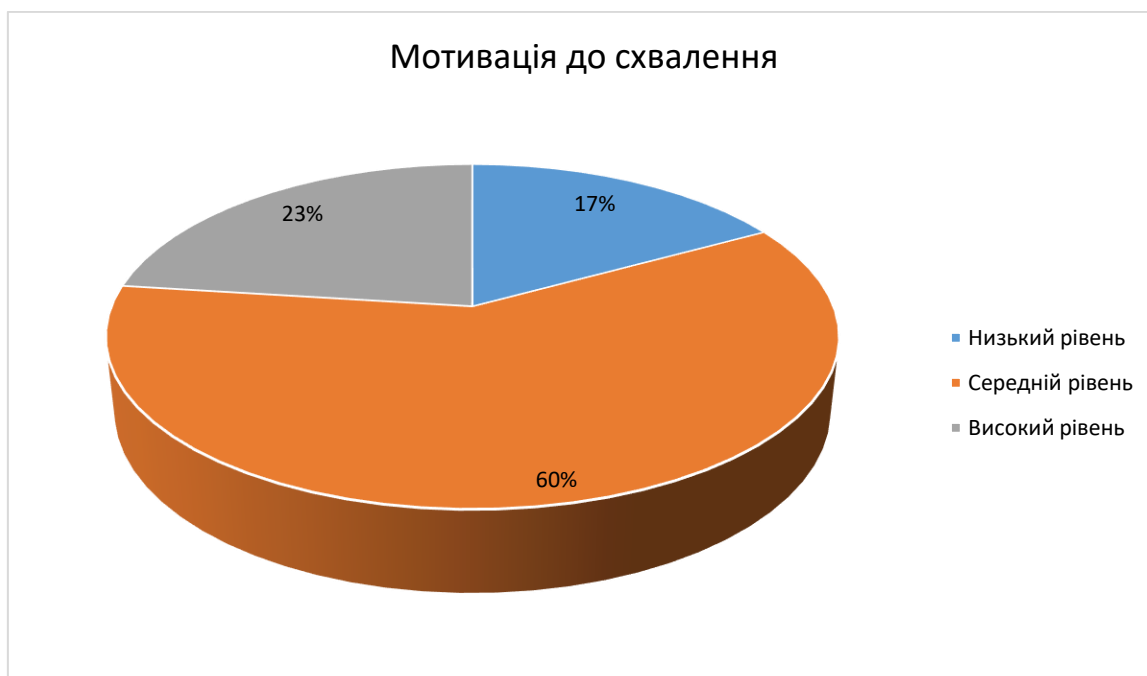
Рис. 2.1. Сегментограма результатів діагностики рівня мотивації до схвалення за методикою «Діагностика самооцінки мотивації схвалення (шкала брехні)» (Д.Марлоу та Д. Крауна)

Рівень мотивації до схвалення опитуваних в процентному співвідношенні представлено на рис. 2.1.