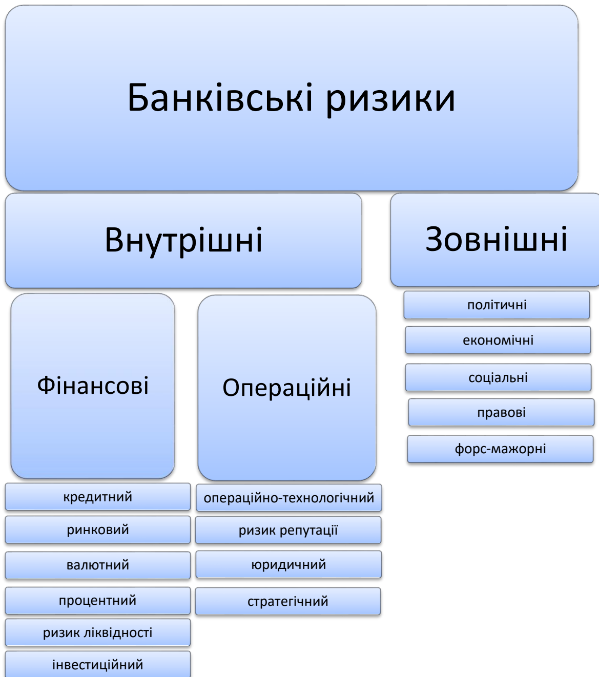
Рис. 1.2. Класифікація банківських ризиків

Форс-мажорні – можливість виникнення збитку через непередбачені обставини, такі як стихійне лихо чи катастрофа.