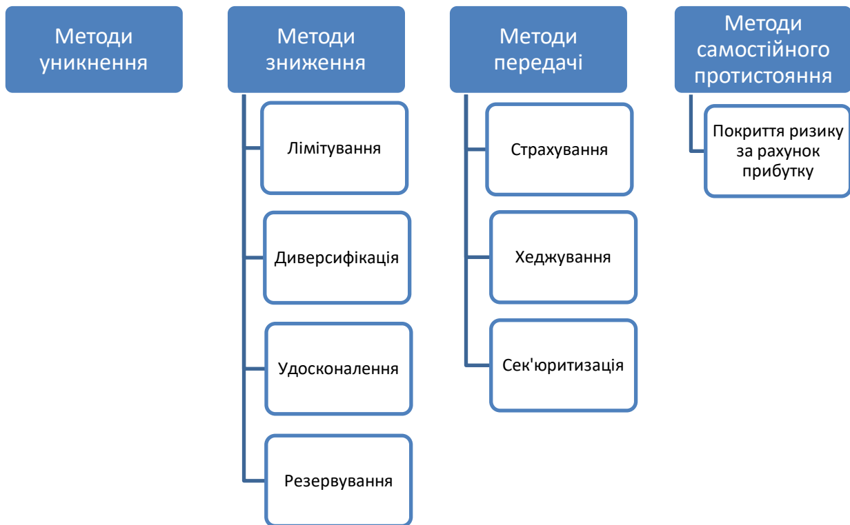
Рис. 2.2. Методи управління банківськими ризиками

Методи уникнення банківських ризиків являють собою відмову від видів діяльності, що є надто ризиковими, проте, це не є зовсім ефективно, адже тоді банк позбавляє себе від прибутку, який можна отримати від провадження тієї чи іншої діяльності. Банк навмисно відмовляється від потенційного прибутку, задля того, щоб убезпечити себе від прояву тих ризиків, що можуть принести великий збиток, похитнути його теперішній фінансовий стан. Тому банківська установа, в першу чергу, намагається втриматись на тому рівні прибутковості, що є наразі, стабільно вести свою діяльність. Проте, може виникнути така ситуація, коли банк відмовляється від впровадження певних інноваційних продуктів, проектів, які вважає надто ризиковими, коли інші банки користуються ними, і ринок потребує таких продуктів. В такому випадку банк може втратити своїх клієнтів та стати не надто конкурентоспроможним в банківському секторі.