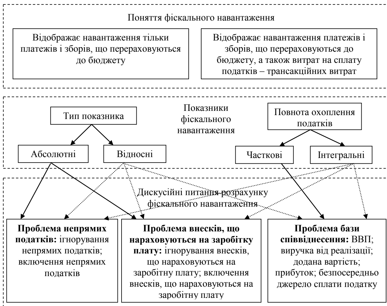
Рис. 3.1. Основні підходи до визначення та оцінки фіскального навантаження

знаменника відносного інтегрального показника фіскального навантаження пропонується прибуток, або додана вартість, а також виручка від реалізації і безпосередньо джерела сплати податків. Підбиваючи підсумки аналізу способів визначення та оцінки фіскального навантаження на макрорівні, представимо основні підходи за допомогою схеми на рис. 3.1.