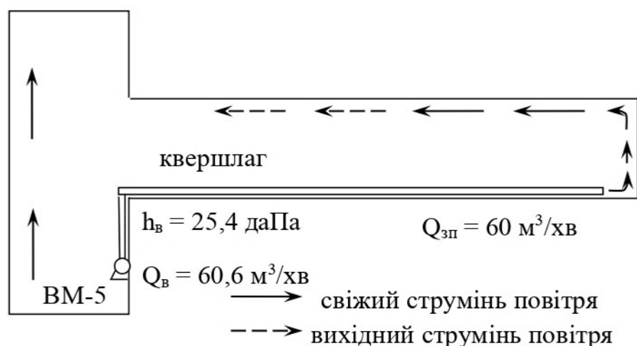
Рисунок 3.3 - Схема провітрювання

Виходячи з отриманих значень Q_{\epsilon} і H_{\epsilon} приймаємо вентилятор місцевого провітрювання ВМ-5.