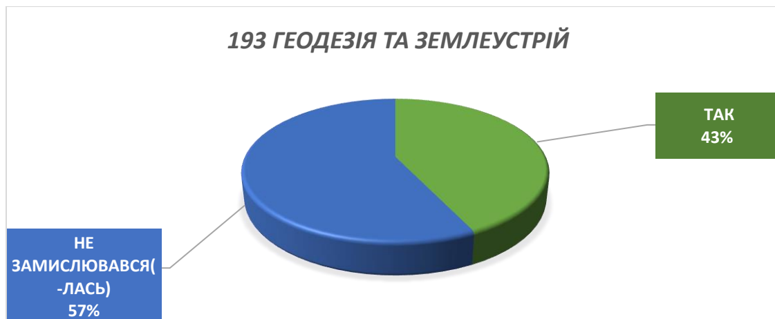
Рисунок 16 – Відповідь на питання «Чи достатньо Вам часу, на підготовку до підсумкового контролю у формі екзамену, під час сесії?»

Рисунок 15 – Відповідь на питання «Чи дозволяють механізми та процедури контрольних заходів повторне проходження форм контролю при наявності академічної заборгованості (двійки, неявка) чи з метою підвищення позитивної оцінки?»