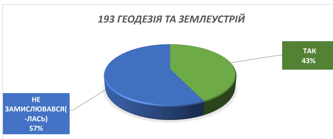
Рисунок 2- Відповідь на питання «Чи оприлюднено це положення на офіційному веб сайті університету?»

Рисунок 1- Відповідь на питання «Чи знаєте Ви, які документи університету містять процедуру проведення контрольних заходів?»