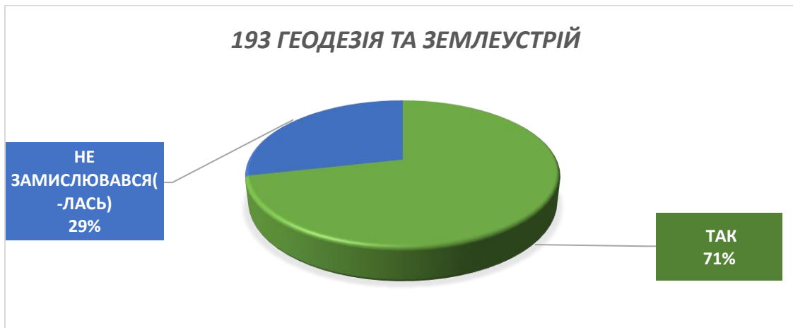
Рисунок 13 – Відповідь на питання «На Вашу думку, які форми поточних контрольних заходів, дозволяють найбільш результативно перевірити досягнення програмних результатів навчання:»